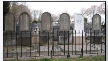
Alignement Risler - cimetière de Mulhouse