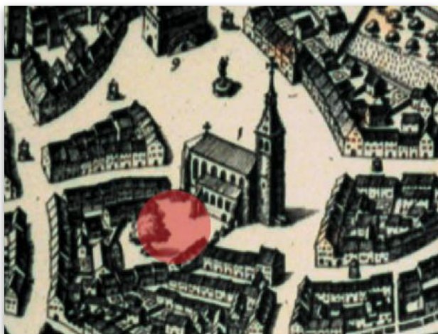
Le cimetière paroissial jouxtant l'église Saint-Etienne

Le cimetière était le cœur du noyau primitif de la ville. Il devient à partir du XIV e siècle un obstacle à son développement.