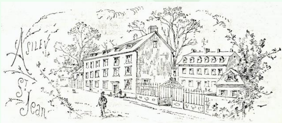
L'Asile Saint-Jean (gravure fin XIXe siècle)

En 1879 il fonda un Asile Evangélique à Mulhouse, futur Asile Saint-Jean, qui devint rapidement son œuvre de prédilection. A cette période, la forte mortalité générait de nombreux orphelins dont le sort était pitoyable.