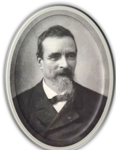
Paul Schutzenberger – 1929