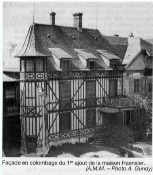
Façade en colombage du 1 er ajout de la maison Haensler.