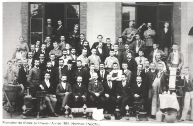
Promotion de l'École de Chimie - Année 1894