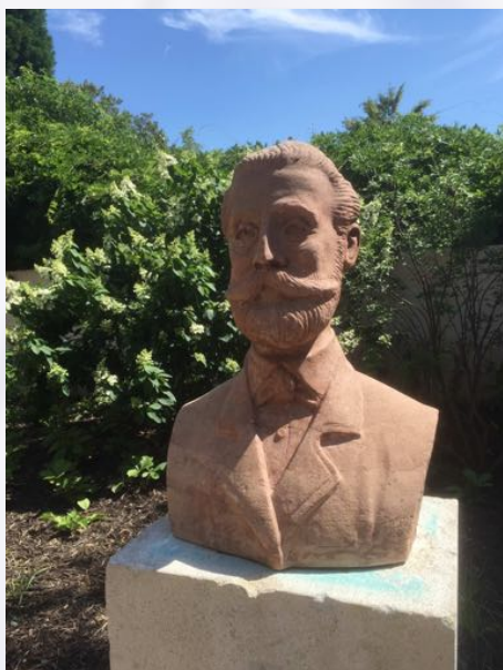
Buste d'Auguste Lustig au Parc Steinbach à Mulhouse