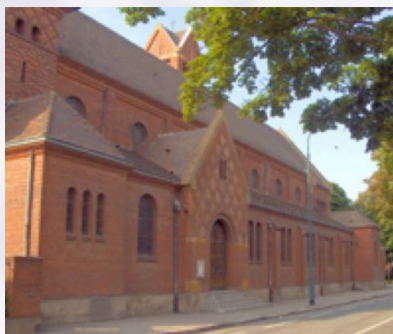
Eglise Ste Thérèse de l'Enfant Jésus à Mulhouse