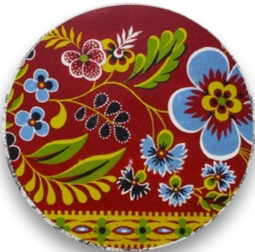
Motif de pensées sur fond rouge andrinople