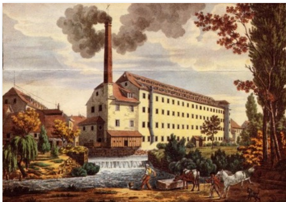
Filature de MM. Nicolas Koechlin & Frères à Mulhouse

Ce fut en effet le premier à faire des études supérieures de chimie à Paris avec le Professeur Fourcroy. Associé dès 1802 à son père comme chimiste dans l'entreprise Nicolas Koechlin et Frères, il ne tarda pas à prendre lui-même la direction technique de cette usine au développement de laquelle il contribua grandement par les progrès qu'il lui fit faire.