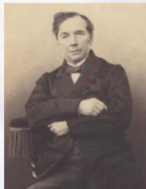
portrait par Gustave Dardel

Il fut décoré chevalier de la Légion d'honneur en 1847.