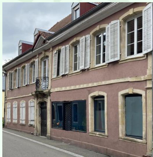
L'ancienne manufacture Schmalzer, 5, rue de la Loi

Il s'établit à Munster en 1776 jusqu'à sa mort le 19 mars 1797.