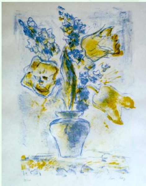
Bouquet de fleurs jaunes Marché aux étoffes Square de la Bourse à Mulhouse