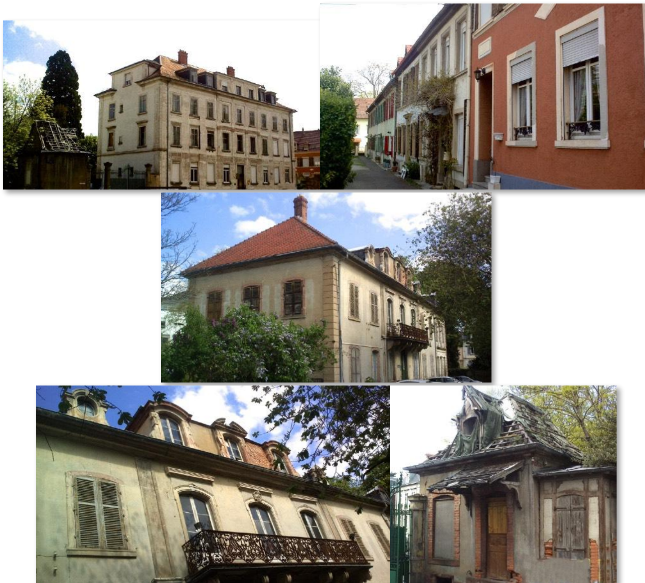
De bas en haut : Boulevard Roosevelt, maison Dettwiller, ancienne barrette de tissage mécanique. La maison Weber, vue d'ensemble et façade avec balcon, ancienne loge de gardien

Il reste aux Anciens de Dollfus & Noack le souvenir d'une aventure humaine exaltante.