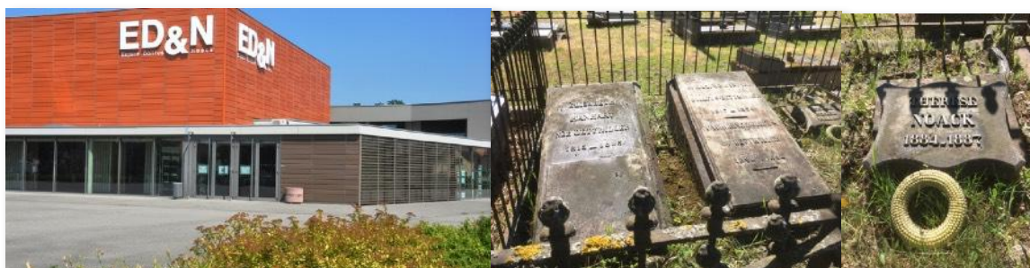
L'Espace Dollfus & Noack à Sausheim / Sépultures Dettwiller-Hanhardt-Noack au cimetière protestant de Mulhouse