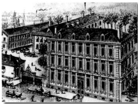
Illustration de papier à en-tête de la société Dollfus Noack Le bâtiment de 1864 (faubourg de Belfort, actuel boulevard Roosevelt), avec sa loge d'entrée à gauche du portail. A l'arrière-plan à gauche, pignon du bâtiment de 1794 avec les stores. Entre la maison Weber et le Steinbächlein avait été inséré un atelier, aujourd'hui disparu.

en Allemagne. La guerre 1939/45 aura des conséquences tragiques, la mort en déportation de Georges à Dachau et la destruction quasi totale de l'usine de Sausheim durant l'hiver 1944/45.