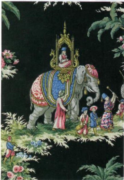
Détail d'un papier peint d'archives.

« Les papiers peints, en particulier les panoramiques, se sont toujours bien exportés », assure Guillaume Tregouet, administrateur de la manufacture de Rixheim. Ils étaient roulés dans des malles puis transportés dans toute l'Europe. Et surtout aux Etats-Unis. A partir des années 1900, des paquebots partaient les cales pleines de papiers peints Zuber. Aujourd'hui encore, outre-Atlantique, le panoramique de la guerre de l'Indépendance américaine est régulièrement commandé. Pour imprimer les 32 lés de cette fresque historique, les artisans doivent préparer