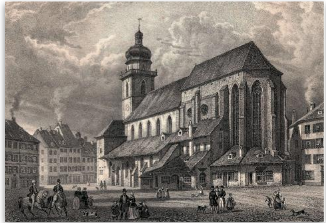
Die ehemalige Stafanskirche (mitte 18ten Jahrhundert)

Die Kirche wird, wahrscheinlich zwischen 1325 und 1350, vergrößert und verschönert, der aus drei Teilen bestehende Chorraum bekam drei flache Endungen.