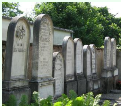
L'alignement Schlumberger au cimetière de Mulhouse

A Niedermorschwihr, la Villa Schlumberger, construite en 1867 à la demande de l'ancien maire de Colmar, fut exploitée comme hôtel durant la guerre sous l'appellation « Ferienheim Waldhof ».