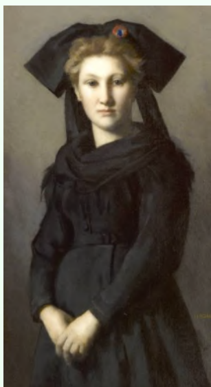
L'Alsace, elle attend (1870)