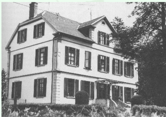
Maison natale de J.J. Henner à Bernwiller et Musée Henner à Paris

Rénovée en 2009, cette demeure typique de l'architecture privée de la IIIe République a retrouvé son style et le décor intérieur. Henner n'y a jamais vécu. Son atelier, qu'il partageait avec Puvis de Chavannes, se situait place Pigalle.