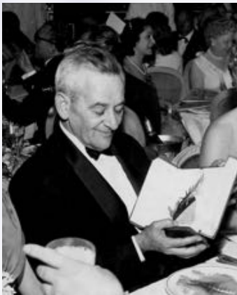
En 1953, au Festival de Cannes Son portrait par l'artiste mulhousien Daniel Tiziani sur une colonne Morris à Mulhouse