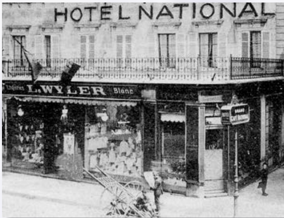
La boutique de lingerie, rue du Sauvage Annonces publicitaires dans le Mülhauser Tagblatt en 1914