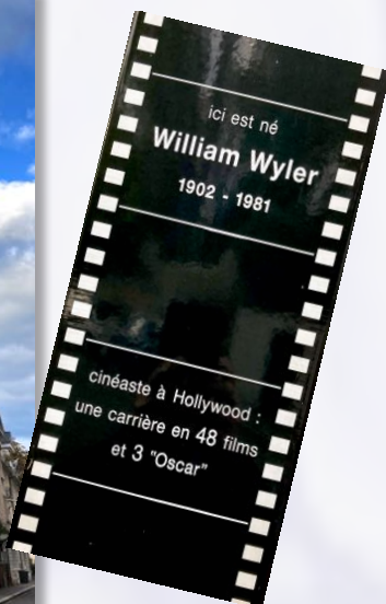
Maison natale de William Wyler, angle rue Zuber et rue de Zurich