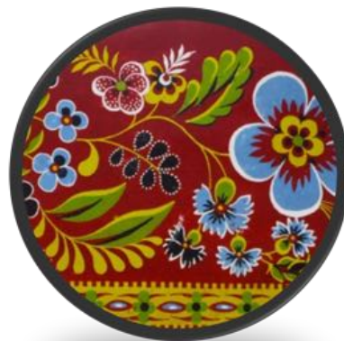
Motif de pensées sur fond rouge andrinople

Daniel Koechlin montra qu'en passant les pièces de coton préalablement imprégnées d'une solution d'un sel d'alumine (le mordant) et séchées par une émulsion d'huile spécialement préparée, puis en teignant ces pièces en garance, en présence de craie, on obtenait une teinte rouge éclatante due à la combinaison de l'huile à la laque de garance. Ce fut le rouge turc ou rouge d'Andrinople.