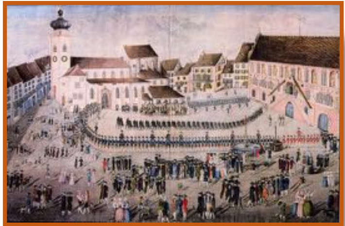
Le SCHWÖRTAG de 1798