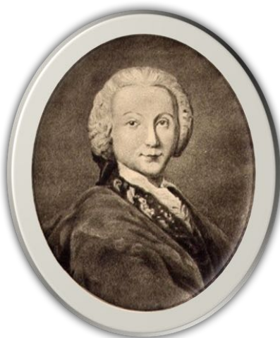
Samuel Koechlin Tableaux généalogiques de la famille Koechlin

En 1743, un jeune mulhousien entreprenant qui avait été employé dans une maison de Bar-le-Duc qui faisait le commerce des toiles peintes hollandaises, avait conçu le projet de monter, avec un teinturier, la fabrication des indiennes à Mulhouse. Ce fut un échec.