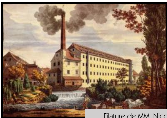
Filature de MM. Nicolas Koechlin & Frères à Mulhouse