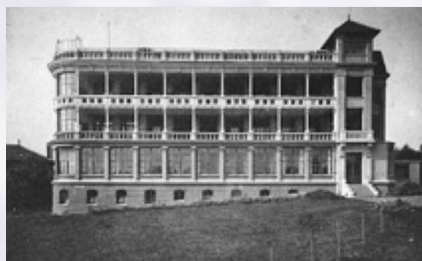
Le sanatorium de Lutterbach vers 1920

Un membre de la Loge « la Parfaite Harmonie »