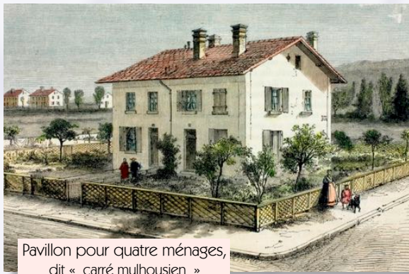
Pavillon pour quatre ménages, dit « carré mulhousien » dessin de Lancelot

Dès 1839, des enquêtes définissent les besoins en logements ouvriers pour Mulhouse. Sociologues et médecins mettent en évidence les conditions difficiles dans lesquelles vit la classe ouvrière. Le docteur Louis-René Villermé, auteur en 1840 d'une étude dans les manufactures mulhousiennes de coton et de