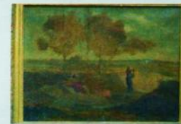
Le Christ et la Samaritaine - huile sur toile