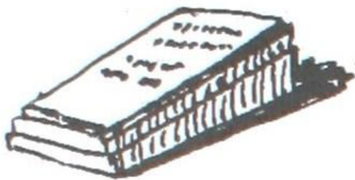
Des dalles horizontales